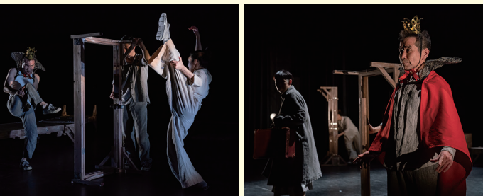
古典名作劇場シリーズ第3弾「はだかの王様」