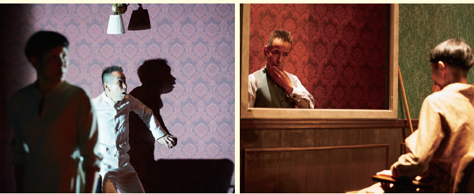
「どこまでも世界」