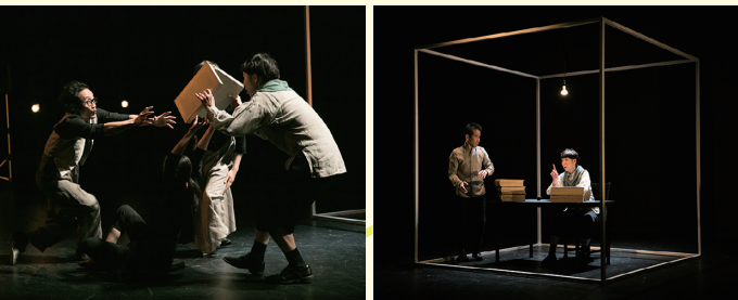
古典名作劇場シリーズ第2弾「ドン・キホーテ」