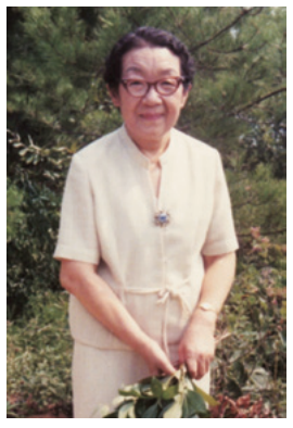
詩人 永瀬 清子 (1906年～1995年)

「はばかりることなくよい思念(おもい)を 私らは語ってよいのですって。 美しいものを美しいと 私らはほめてよいのですって。 失ったものへの悲しみを 心のままに涙ながしてよいのですって。」 永瀬清子詩集現代詩文庫「039」美しい国より抜粋