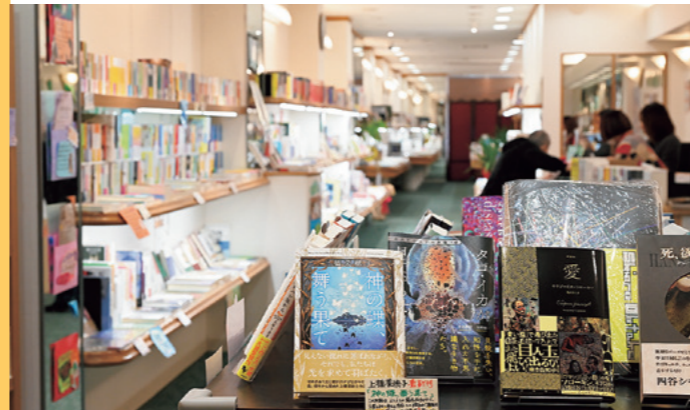
「正夢書房」店内。表紙を見せた陳列が多く、本への興味が深まる