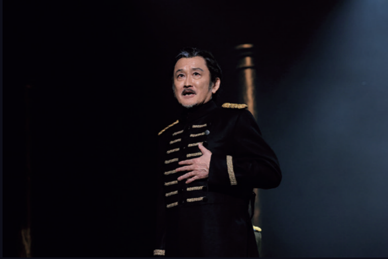
2024年5月『ハムレット』(彩の国さいたま芸術劇場大ホール)

吉田 『リア王』はシェイクスピアの四大悲劇のひとつですが、それほど多くの人に馴染