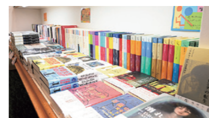
■オモテマチブックスクエア 正夢書房 岡山市北区表町2-2-57 TEL 086-206-1411 営業時間▶10:00~19:00 休業日▶火曜日、他不定休あり ※「正夢書房」「ハーストリー」「ヒズストーリー」「アジュドル」各店の情報はInstagram (@masayume_shobo0315) で確認を

「読書会や創作劇、デッサン会などのイベント企画、カフェ営業など、街の人がゆっくり滞在できる仕掛けもあります。本屋らしくないかもしれませんが、遠慮せずふらっと来てほしいですね。お客さまと話すのが大好きですし、喜んでもらえるのが何よりうれしくて」。個性を打ち出しつつ、商店街らしい顔の見える接客、親しみやすさがあるのも魅力。小さな街の書店から、まだ見ぬ新たな世界が広がるかもしれない。