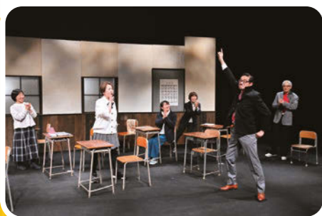
『老人ハイスクール』