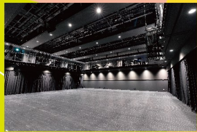
岡山芸術創造劇場 ハレノワ 小劇場