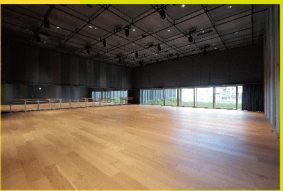
岡山芸術創造劇場 ハレノワ アートサロン