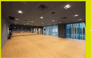
岡山芸術創造劇場 ハレノワ 練習室