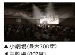
▲小劇場(最大300席) ◀中劇場(807席)